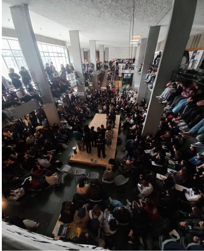
Resim 1. ODTÜ Mimarlık Fakültesi, 24 Mart 2025

mekânsal pratiklerle etki düzeyini nasıl genişlettiğini, hem de bu pratiklerin bir biçimiyle mekânda sürdürülen, aktarılan ve elbette ki kendi politik bağlamında yeniden kurulan boyutlarını tarihsel bir ilişkisellikte gözler önüne seriyor. Bu açıdan boykot, üniversite mekânlarını boş bırakan değil, bu mekânların kullanımını ve anlamını yeniden tanımlayan bir dizi eylemlilik anlamına geliyor. 19 Mart'ta başlayan süreç de hem fakülte mekânının öğrenciler tarafından sahiplenilmesi hem de kendilerini mimarlık öğrencisi olmanın ötesinde toplumsal dertleri, itirazları ve amaçları olan politik özneler olarak konumlandırımlarıyla birlikte işledi. Süreç içinde Mimarlık Topluluğu'nun yayınladığı bir bildiriye geçen şu ifadeler, bu durumu çok net ve güzel biçimde özetliyor: "Kentler, meydanlar, kampüsler ya da fakülteler; yalnızca fiziksel yapılar değil, aynı zamanda ideolojik tahakkümün ya da kolektif direnişin taşıyıcılarıdır. Biz bu boykotla, mekânın tarafsız olmadığını, onun tarihsel olarak seçilen ve yeniden kurulan bir mücadele alanı olduğunu hatırlatıyoruz" (ODTÜ Mimarlık Topluluğu, 2025).