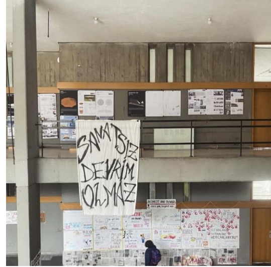
Resim 3&4. ODTÜ Mimarlık Fakültesi, 26 Mart 2025, © Duygu Gören