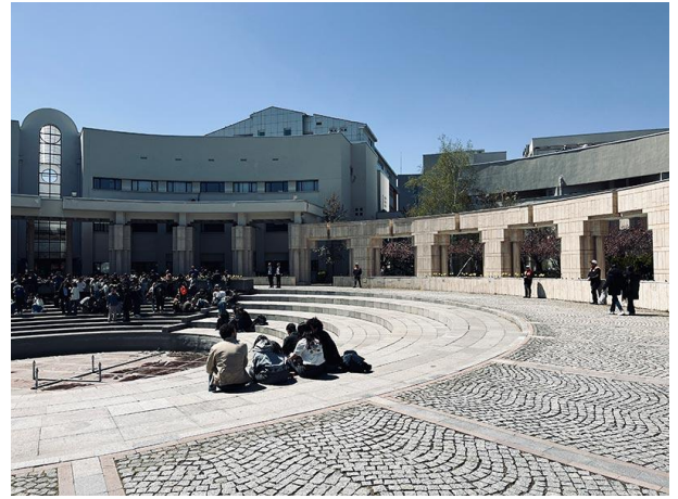
Resim 5&6. Bilkent Üniversitesi, 15 Nisan 2025

Bir diğer özel üniversite olan Başkent Üniversitesi, bir başka kolektif inisiyatif girişimine sahne oldu. İlk dönem Mimarlıkta Rahatsız Edici Sorular çalışması kapsamında açık derslere katılan öğrencilerin kampüs mekânlarını daha kapsayıcı ve erişilebilir hale getirme gayesi, 19 Mart sürecinde artan bir istekle öğrenciler arasında gündem haline geldi. Üniversite topluluklarının bürokratik süreçleri, sürekli sansür ve inceleme tehdidi altında bulunmaları, bu kulvardan bir girişimi zorlaştırırken, kampüste hem fiziksel hem sosyal anlamda "alanımız" olarak sahiplenilebilecek bir mekânın olmayışı, bu arayışı bir yandan daha gerekli kılıyordu. Agrega çalışması tam da bu arayışın ürünü olarak ortaya çıktı. Eylemlilik süreci öncesinde buluşma ve sosyalleşme noktası olarak işleyen fakülte ve kafe bahçelerinin zemininde yer alan taşlar, bir araya gelmeyi, buluşmayı hatırlatıcı bir öğe olarak kullanılarak, sansürü delen bir imgeye dönüştü. Öğrencilerin halk arasında micir olarak bilinen bu taşları floresan turuncu renge boyayarak elden ele dolaşan bir nesne olarak işlevselleştirmesi, sansürü bir görünürlük aracı olarak tersyüz etmeyi ve doğrudan temas sağlamayı mümkün kılarken aynı zamanda betonun mukavemetini artıran bir malzeme olarak sembolik bir anlam taşıyordu. Bu sessiz eylem, kampüs içindeki sınırlı hareket alanında, kolektif bir eylemlilik içinde olan bireylerin varlığını gizli ama görünür hale getirmenin, bir araya gelmenin bir yolu olmuştu. Alınan forumlarda ve farklı