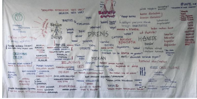
Resim 9. Atölyelerde kolektif üretilen bez, 11 Mayıs 2025

kurma imkânı bulamayan öğrenci, hoca ya da genç profesyonelleri aynı masanın etrafında bir araya getirdi ve sonraki hareketlilik anları için hazırlıklı kılan bir dayanışmayı kurdu.