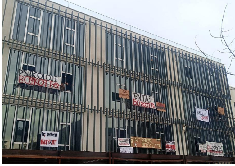
Resim 8. TEDÜ 25 Mart 2025

Bu deneyim, belki de TED Üniversitesi için kampüs içinde gençlik hareketinin kendi mekânsal ifade biçimlerini kurmaya başladığı ve direnişin ilk kez belirgin biçimde mekâna kazındığı bir dönem olarak anımsanacak.