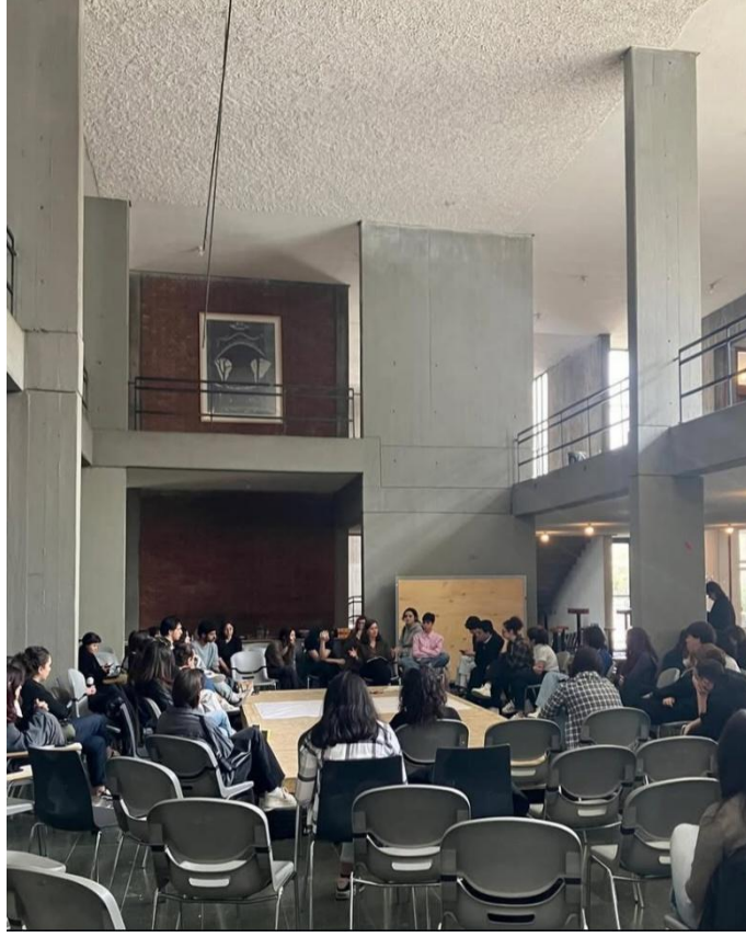
Resim 2. ODTÜ Mimarlık Fakültesi, 27 Mart 2025