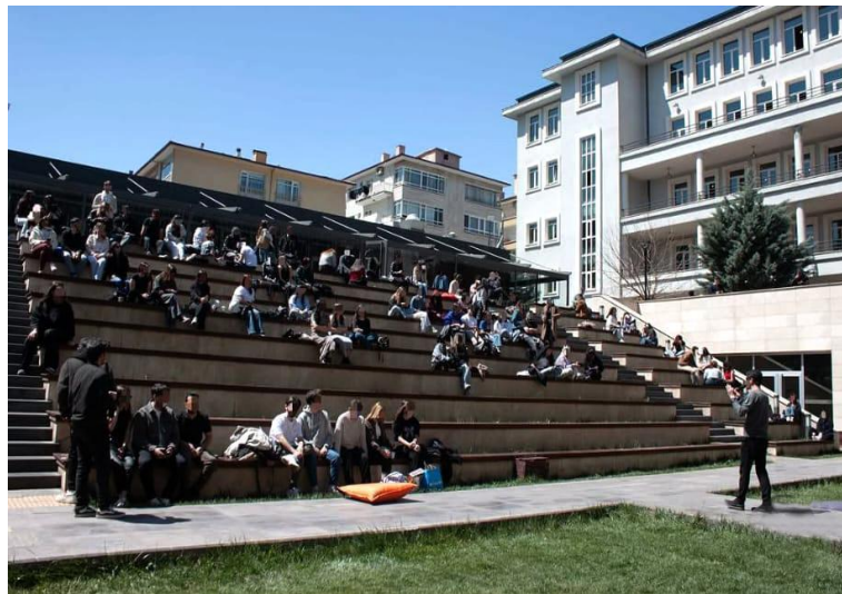
Resim 7. TEDÜ, 17 Nisan 2025, ©@tmesalehareketi [Instagram]