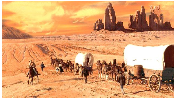
Fotoğraf 10: Uçsuz bucaksız topraklara giden Yerleşimciler, Batı Nasıl Kazanıldı filmi

Hollywood sineması, bu siyasi tezi doğa kanunu gibi sunan Batı Nasıl Kazanıldı