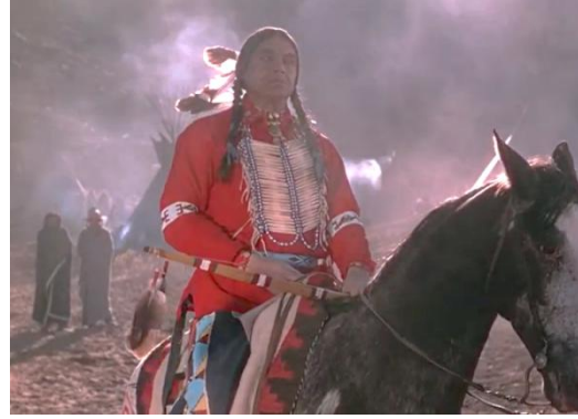
Fotoğraf 9: Şiddet yanlısı gösterilen Kızılderili savaşçı, Sarı Kurdeleli Kız filmi

https://www.youtube.com/watch?v=wCCCwkcBOOw