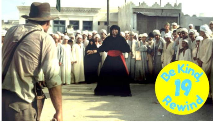
Fotoğraf 2: Kutsal Hazine Avcıları filminden Indiana Jones ile kılıç ustası karşı karşıya

Sinemada ayrımcılık her zaman Bir Ulusun Doğuşu (The Birth of a Nation, 1915, Yönetmen: D. W. Griffith) filmindeki gibi açık bir ırkçılıkla veya Nazi Almanyası'nın İradenin Zaferi (Triumph des Willens, 1935, Yönetmen: Leni Riefenstahl) filmindeki gibi doğrudan bir ideolojik dayatmayla yapılmaz. Modern sinemada asıl tehlike, doğrudan gösterilenden ziyade örtük olandır. Çünkü bu durum izleyicinin zihnine sızan gizli bir kültürel kodlama mekanizması gibi işler.