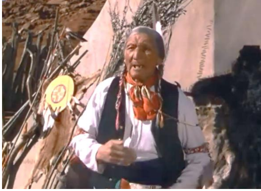
Fotoğraf 8: Hristiyanlığı benimsemiş yerli şef, Sarı Kurdeleli Kız filmi